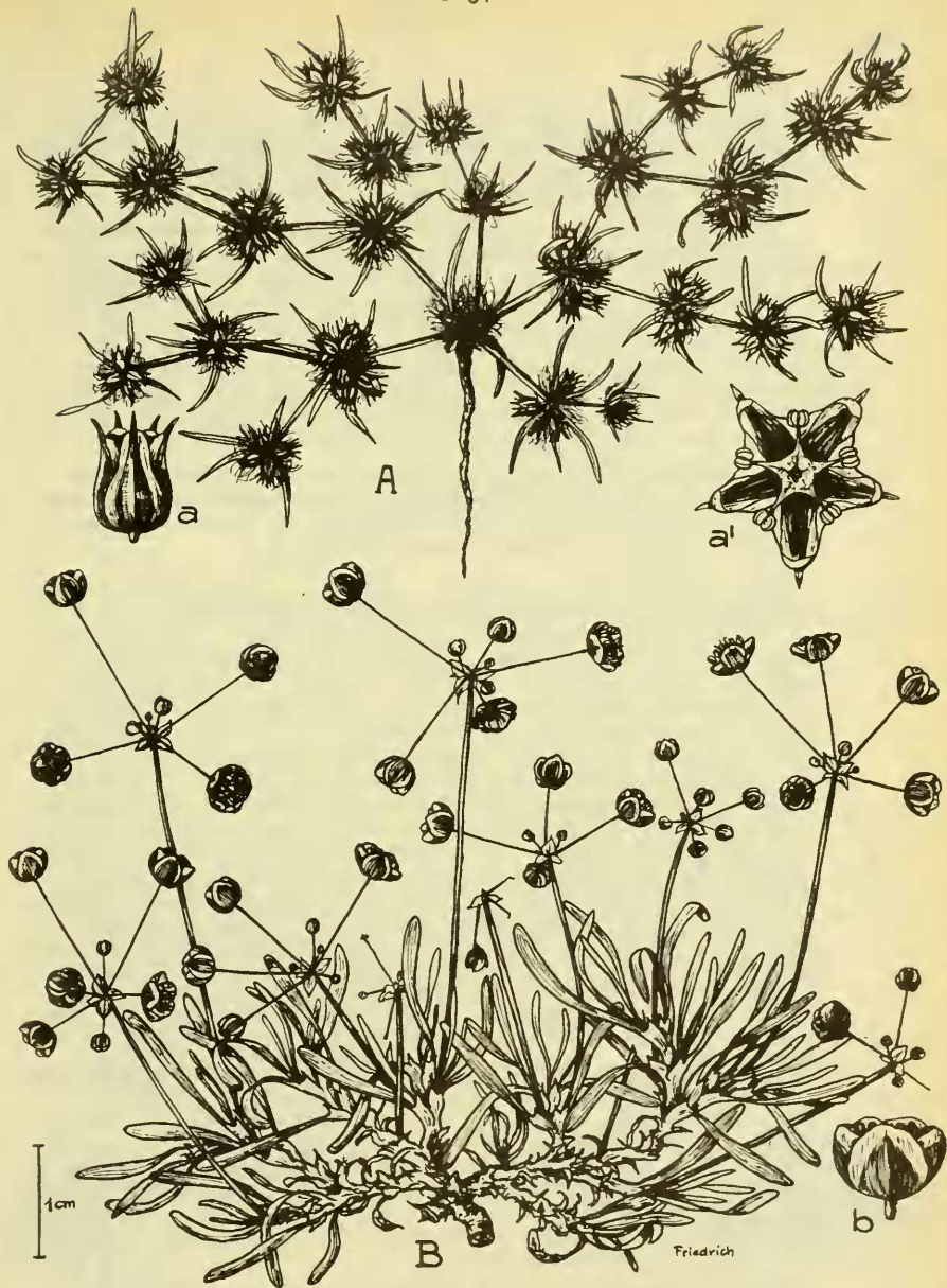
A. Suessenguthiella scleranthoides (Sonder) Friedr. Habitus nat.Gr. a. Blüte von der Seite, a', aufgeklappt (Fruchtknoten entfernt) 5x. B. Hypertelis caespitosa Friedr. Habitus nat. Größe. b. Blüte von der Seite, 2,5 x.